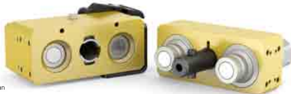
Multi-X Duo 25 – Una solución múltiple única para dos líneas

Dispone de una amplia gama de accesorios y piezas de repuesto.